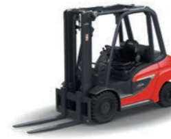
H20 - H35 V-Stapler Tragfähigkeit: 2,0 t - 3,5 t