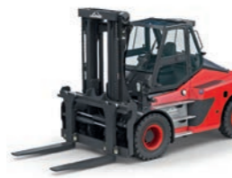
HT100 - HT180 Schwerlaststapler hydrodynamischer Antrieb Tragfähigkeit: 10,0 t - 18,0 t