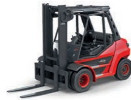
H50 - H80 EVO V-Stapler Tragfähigkeit: 5,0 t - 8,0 t