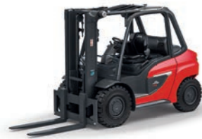
H35 - H50 V-Stapler Tragfähigkeit: 3,5 t - 5,0 t