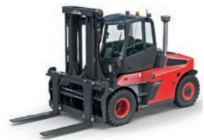
H100 - H180 Schwerlaststapler hydrostatischer Antrieb Tragfähigkeit: 10,0 t - 18,0 t