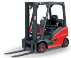
H14 - H20 EVO V-Stapler Tragfähigkeit: 1,4 t - 2,0 t